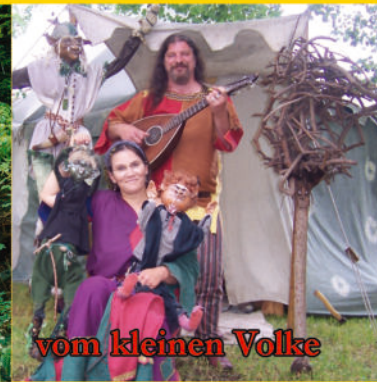
vom kleinen Volke